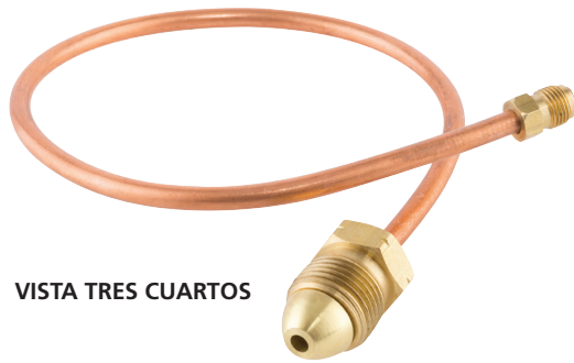
VISTA TRES CUARTOS